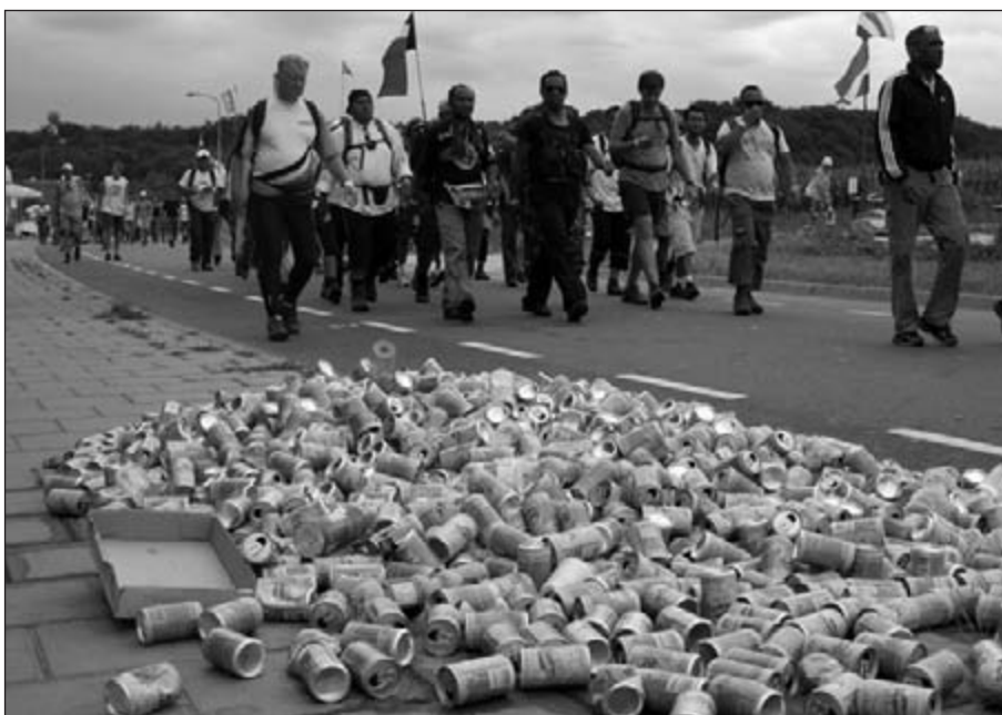
Vlabbij de OLAT-post lag deze afvalberg van gratis uitgedeelde ijsthee-blikjes. Reclame?