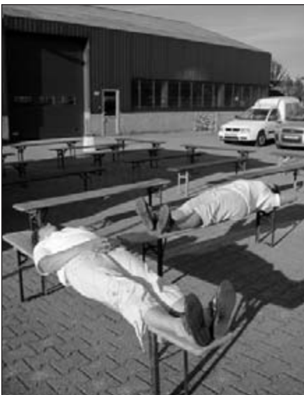
.... en laat nu de eerste maar komen ....

Er volgde een gestage stroom van wandelaars die graag even kwamen pauzeren, die de OLAT-prijzen wisten te waarderen en alom complimenten uitdeelden voor de heerlijke soep! We konden met ons team de mensen snel voorzien. We hadden zelfs nog wel wat meer aanbod kunnen verwerken. Maar