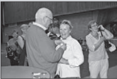
Op pad met De Heerlijkheid