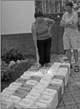
.... jerrycans vullen ....