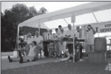
Op post in Nijmegen: leuk!