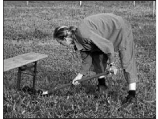
.... de wei vlaai-vrij maken ....