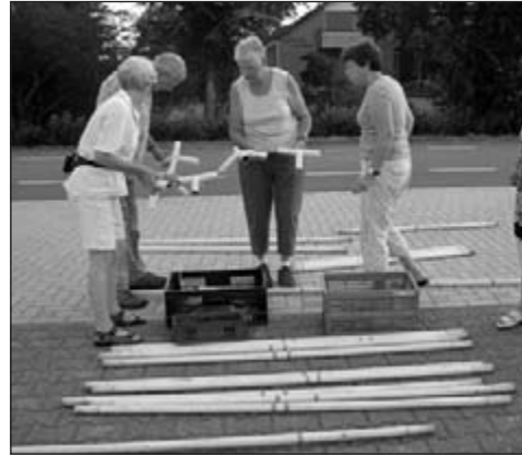
.... puzzelen met stukjes tent ....