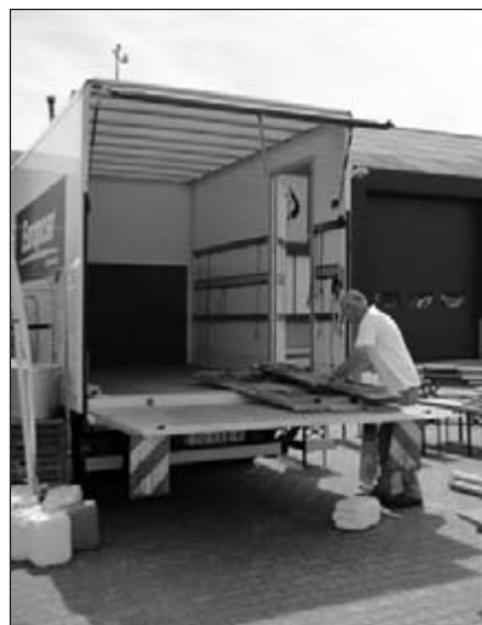
.... inpakken na afloop ....